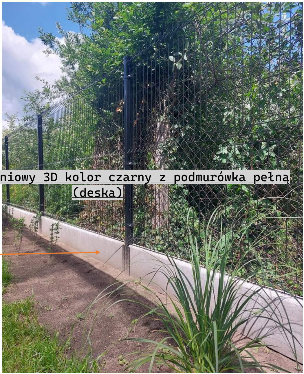
Panel ogrodzeniowy 3D kolor czarny z podmurówka pełną (deska)