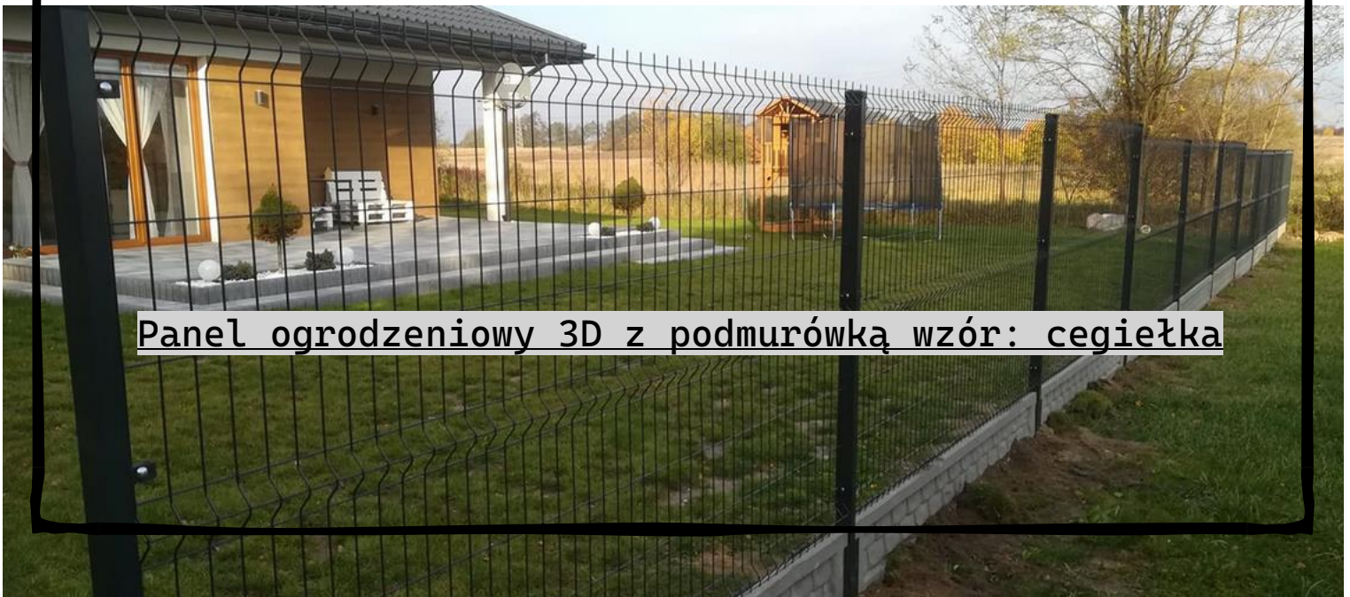
Panel ogrodzeniowy 3D z podmurówką wzór: cegiełka