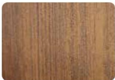
Ciemny dqb mat