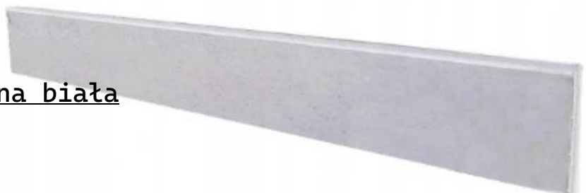
Podmurówka wibroprasowana biała