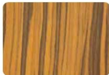
Drewno różane mat