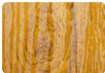
Jasny dqb fakturowany polysk