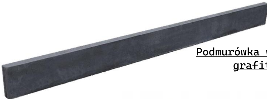
Podmurówka wibroprasowana grafitowa