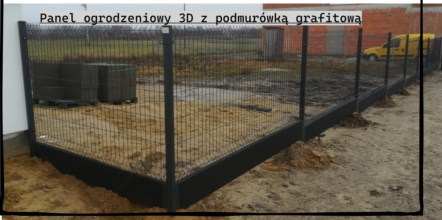
Panel ogrodzeniowy 3D z podmurówką grafitową